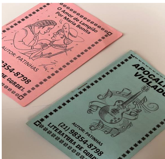
Imagem 3 - Livreto de Cordel Praça

As imagens 1 e 2 foram coletadas durante o projeto de pesquisa "Alimentar Saberes, Promover Saúde: Experiências de Sustentabilidade na Escola Municipal Ivani Vigne Babo", realizado em Nova Iguaçu/RJ. O objetivo do projeto era fortalecer o aprendizado dos alunos do Ensino Fundamental II por meio de um trabalho de reforço escolar, integrando aulas de Língua Portuguesa e Literatura com elementos como arte, pintura, leitura, escrita e jogos. A proposta era despertar o interesse e a participação ativa dos alunos.