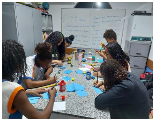
Imagem 1 - Atividade de Xilogravura