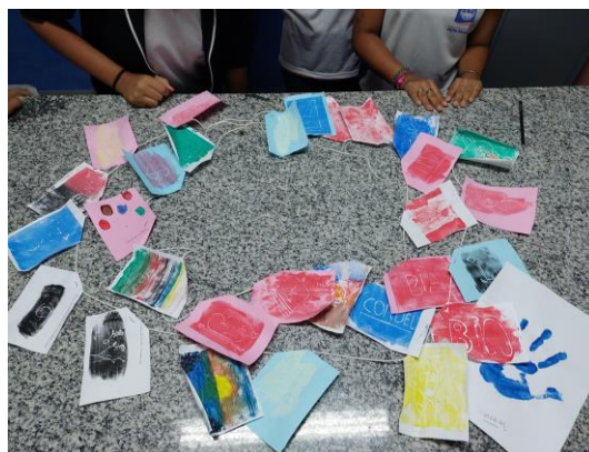
Imagem 2- Resultado da Atividade